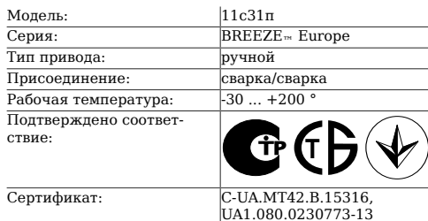
Таблица 1. Характеристики